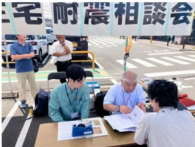
木造住宅耐震化相談会の様子

また、耐震改修工事費が高額であることも耐震化が進まない要因であるため、廉価なローコスト工法による耐震改修工事の提案について、耐震診断士や工務店に周知を図ります。