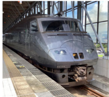
特急ひゅうが号（延岡～宮崎空港）