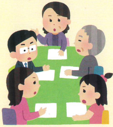
地域課題への対応