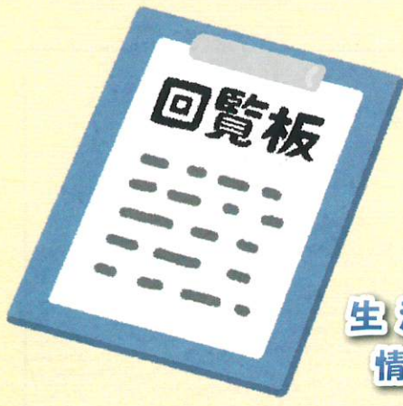
生活に必要な 情報の回覧