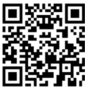
二次元バーコード