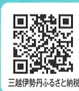
三越伊勢丹ふるさと納税