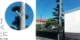
～夜道を明るく照らすLED防犯灯～

日向市が設置・管理している防犯灯をLEDに更新しました。より明るくなり、防犯抑止効果が得られたことに加え、温室効果ガスを軽減できるので地球温暖化防止に役立っています。