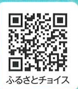
ふるさとチョイス