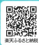
楽天ふるさと納税