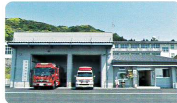
～新しくなった日向市消防署南分遣所～

小学校グラウンド跡地を活用し、救急車を配備できる分遣所を新築しました。消防車に加え救急車を配備することで、市南部地区の救急対応が大幅に改善されました。グラウンドは、ヘリポートや訓練場として活用され、災害時には、市南部地区の災害拠点となります。