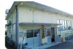
～遠見区(幸脇地区)自治公民館～

「高見橋通り区自治公民館」の空調設備を設置しました。夏期にも活動や会議を開催できるようになりました。「遠見区自治公民館」の大広間を改修しました。百歳体操や交流活動がより活発になり、子どもたちや高齢者の健康や地域のつながりに役立っています。