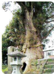
～栗尾神社(日向市塩見)のくす～

市内小学生の河川環境の学習として水辺環境調査を実施。河川環境モニターによる市内8河川の監視など、河川環境への関心を高めることや環境維持に役立ちました。市民一斉清掃活動「クリーンアップ日向」を実施。ボランティア清掃活動にごみ袋や軍手を支給し支援を行ったほか、市民に親しまれている保存樹等の保護を行い、自然環境の保護に役立ちました。