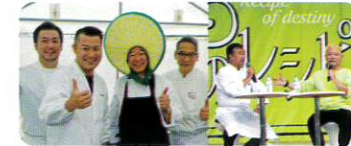
～食の祭典「運命のレシピ」～

NHK 地域ドラマ「ひなたの佐和ちゃん、波に乗る!」では、日向市を舞台にサーフィンをテーマにしたドラマを制作、全国に放映されました。国際サーフィン大会など各種大会助成を行ったほか、著名料理人による地域食材を活用した食の祭典「運命のレシピ」への助成を行いました。