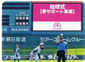
～女子ソフトボールの始球式で好投する日向市の中学生～

小中学校のパソコン教室のパソコンを年次的にデスクトップ型からタブレット型へ更新しています。また、小学校算数のデジタル教科書を活用したことで、わかりやすい授業の展開や、教職員の働き方改革につながっています。