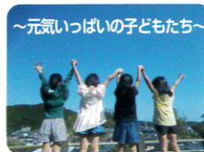
～元氣いっぱい子どもたち～

「日向市子どもの未来応援推進計画」を見直し、第2期計画を策定しました。策定にあたって、保護者などを対象に生活実態・ニーズに関するアンケート調査の実施。また、地域の子どもの居場所「まなびスペース」の設置による学習支援や居場所支援など、継続した支援活動に役立っています。