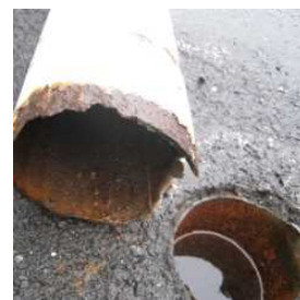
ポール看板の倒壊