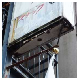
袖看板の底部脱落

そのような事態にならないよう、危険箇所を発見したら屋外広告主 や屋外広告業者などの専門業者に相談しましょう。