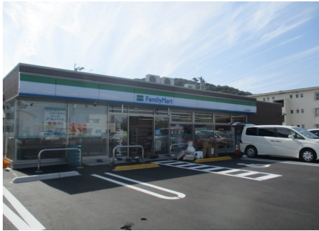
(仮称)FM日向江良町店新築工事