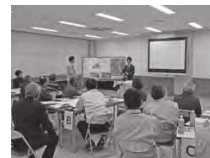
▲ワークショップの様子