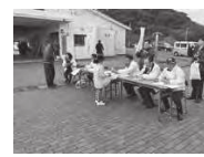
▲デザイン審査の様子

1月12日（土）、お倉ヶ浜で、第11回新春たこあげ大会を開催しました。今回は、授業でたこ作りを行った平岩小中学校1・2年生をはじめ、市内外から37名の参加があり会場は大変賑わっていました。