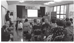
恒例のソバの振る舞いやイチゴの販売もありましたよ！

参加者は、「身近な塩見城の歴史が勉強できてよかった。」「近日中に自分で歩いてみたい。」「地元への関心を深めていました。」