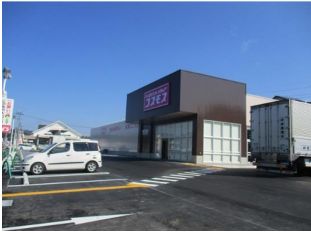
ドラッグコスモス亀崎店