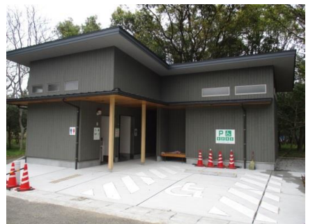
伊勢ヶ浜門前まちトイレ