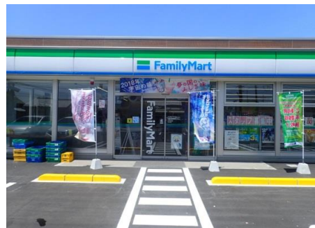
ファミリーマート日向日知屋店