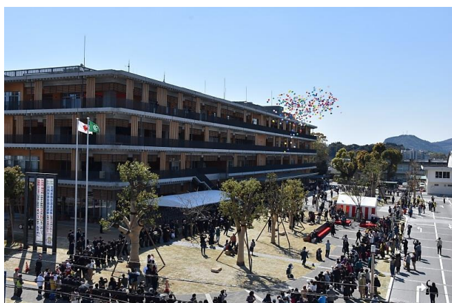
平成31年3月24日新庁舎グランドオープン