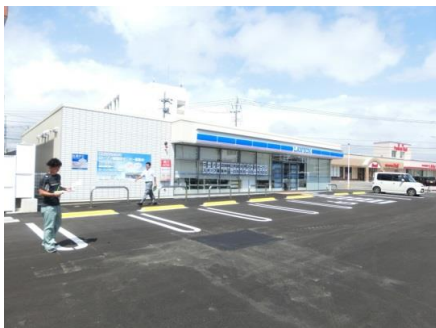
ローソン日向向江町店