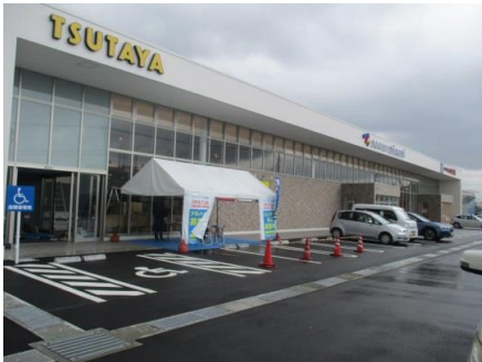
ブックスミス日向店