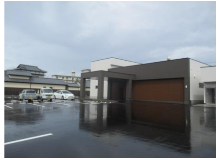
なおの耳鼻咽喉科