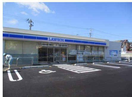
ローソン日向亀崎西二丁目店