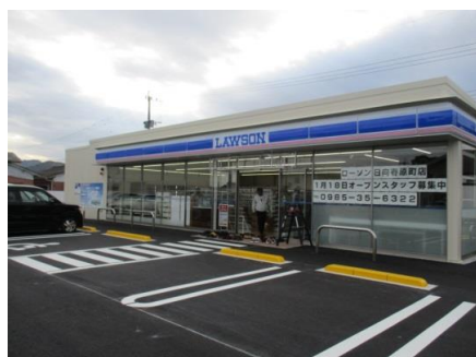
ローソン日向春原町店