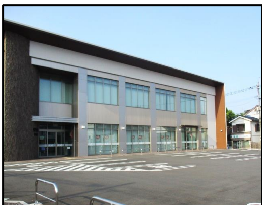
宮崎銀行日向支店