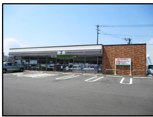
セブン-イレブン日向都町店