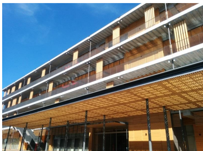
平成30年5月1日新庁舎開庁