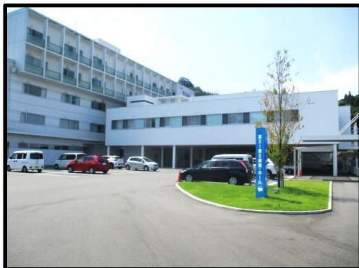
鮫島病院 第一病棟