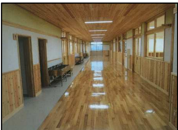
日向中学校増改築事業 管理・普通特別教室棟