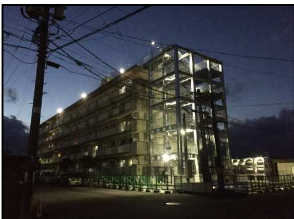
地震・津波防災施設整備事業 財光寺北住宅屋外避難階段