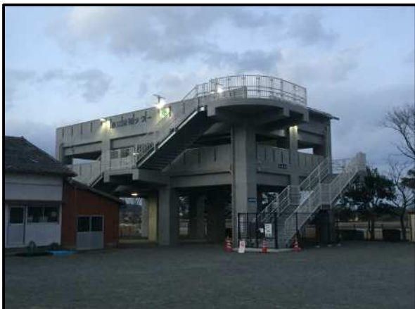
地震・津波防災施設整備事業 長江区津波避難タワー