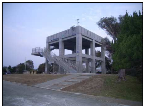
地震・津波防災施設整備事業 堀一方区津波避難タワー