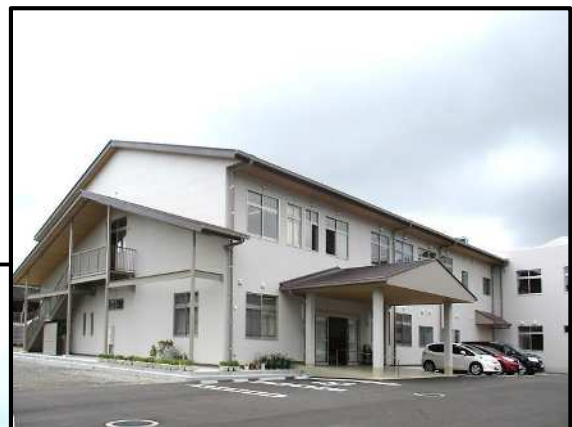
日向中学校 管理・普通特別教室棟