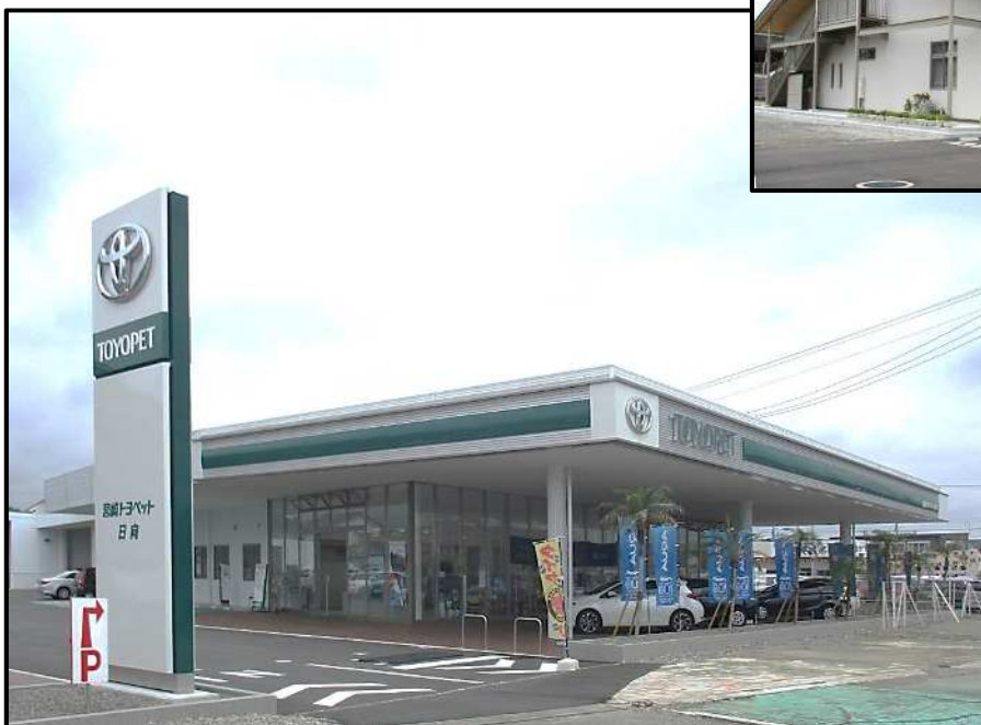
宮崎トヨペット日向店