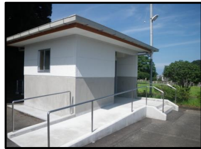
城山墓地駐車場トイレ