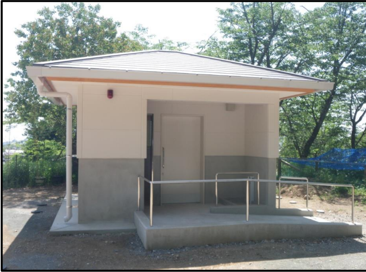
富高慰霊塔敷地トイレ