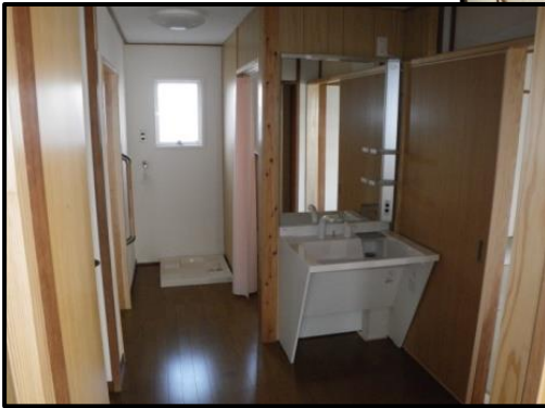
塩田住宅 高齢者向け改修