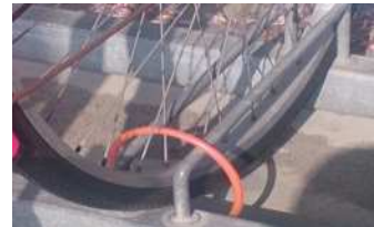
前輪にもロックを付け、2重ロックにすると安全です。

公共駐輪場に関するお問合せはこちらまで 都市計画課 都市総務係 (Tel 52-2111 内線2712)