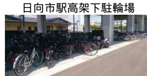
日向市駅高架下駐輪場 自転車ラックの所に駐車しましょう

日向市駅高架下駐輪場では、バイク駐車区画を設置しましたので、バイクは所定の場所に駐車してください。