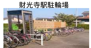
財光寺駅駐輪場 駅前広場ロータリ - 内は通行の妨げにならない場所に駐車しましょう

自転車の盗難が多発しています。必ず鍵をかけましょう。自転車盗難の9割以上が無施錠です。