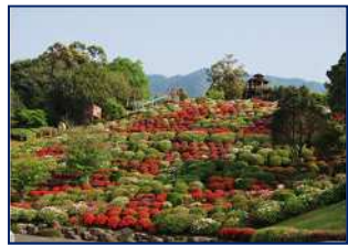
牧水公園のつつじ