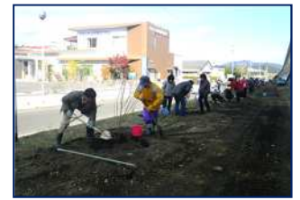
活動団体による植樹

本市の主な地域資源の拠点となる地域を公園化の拠点ゾーンとして、地域の特性に合った緑化や眺望スポット等の整備を行い、地域住民の皆様と連携を図りながら、県内外からの来訪者の増加や地域の活性化を推進します!!