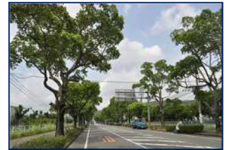
新開橋付近の楠並木通り