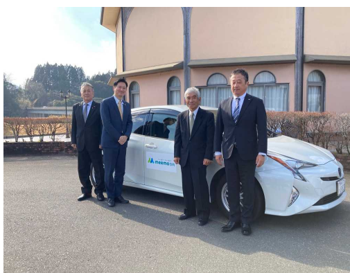
令和8年1月13日東郷地域「meemo」体験乗車会出発セレモニーの様子