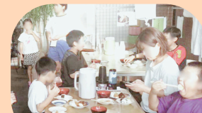
こども食堂（市内9カ所）