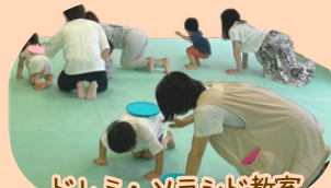
ドレミ・ソラシド教室

乳幼児健診や遊びの教室、園訪問等で、保護者と一緒に子どもたちの心身の成長を確認。言語・育児相談等にて発達面についてアドバイスをしています。