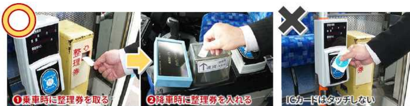
▲ 利用方法のイメージ