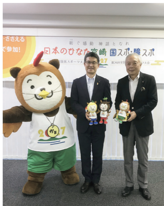
公益財団法人日本パラスポーツ協会を表敬訪問した河野俊嗣知事