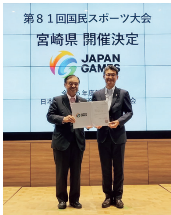
公益財団法人日本スポーツ協会にて「開催決定書」を受け取った河野俊嗣知事

来県される全ての方々に、本県の豊かな食や自然・文化、温かい人柄など、多彩な魅力を感じていただけるよう、「県民総参加型による“おもてなしの心”あふれる大会」を目指してまいります。