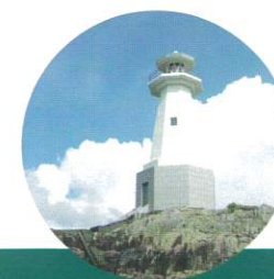
美々津灯台 The Sea of Hyuga

Hours: 9:00AM—4:30PM Closed Mondays and New Year's Price: Adults ¥210 / Elementary, Junior High, and High school students ¥100 ※20% off for groups of 20 or more Phone: 0982-58-0443 (Japanese only)