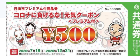
※商品券イメージ (第1弾の元気クーポン券)