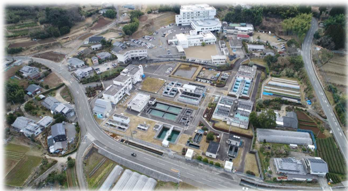
日向市権現原浄水場施設全景