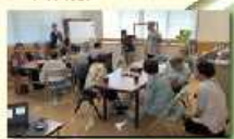
＜コミュニティカフェ＞

高齢者の高い場や難しい場があります。 介護予防教室(いきいき百歳体操) 高齢者クラブ 自治公民館地域活動 ふれあいいきいきサロン 認知症の人にやさしい図書館 コミュニティカフェ 認知症カフェ