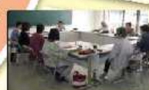
＜傾聴ボランティア＞