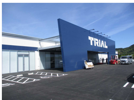
(仮称) TRIAL日向日知屋店