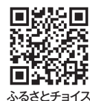
ふるさとチョイス