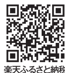
楽天ふるさと納税