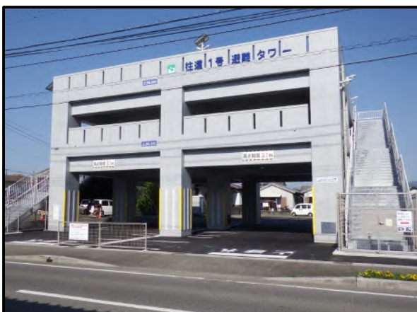
地震・津波防災施設整備事業 住還1号避難タワー