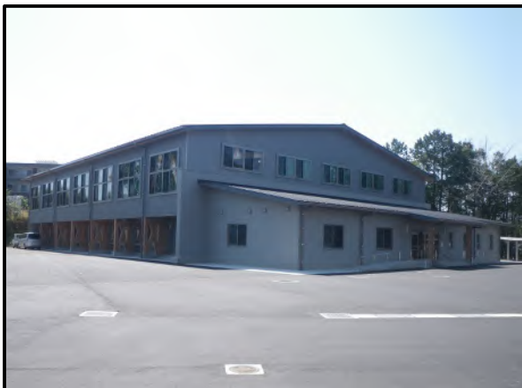
日向中学校増改築事業 屋内運動場