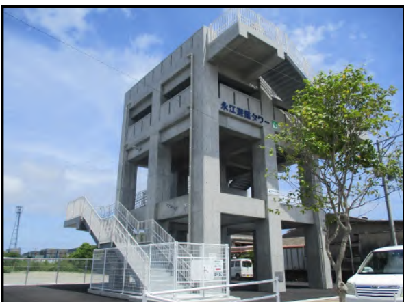
地震・津波防災施設整備事業 永江避難タワー