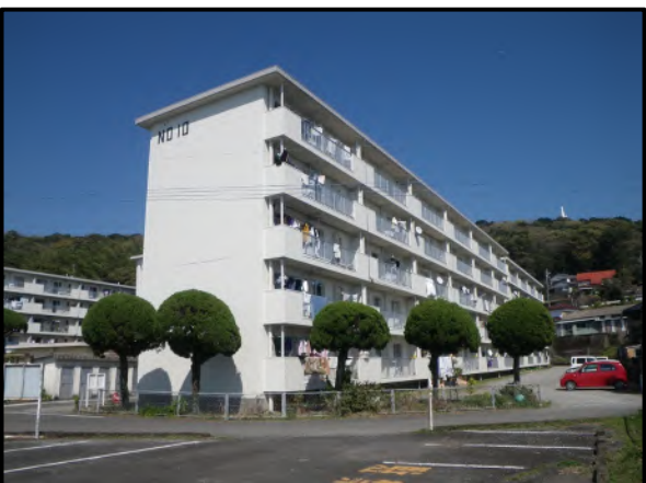
櫛の山住宅ストック総合改善事業 10号棟