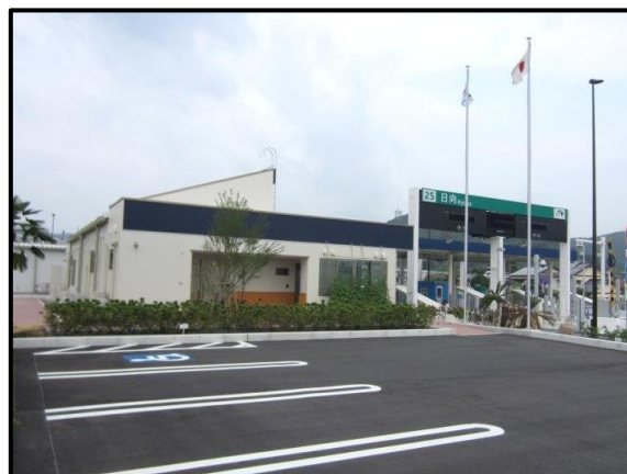
高速道路料金事務所