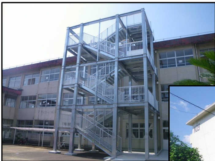
日知屋小学校 避難階段