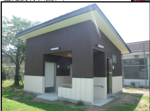
塩見農村公園トイレ