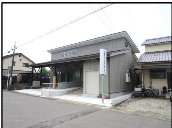
下原町自治公民館