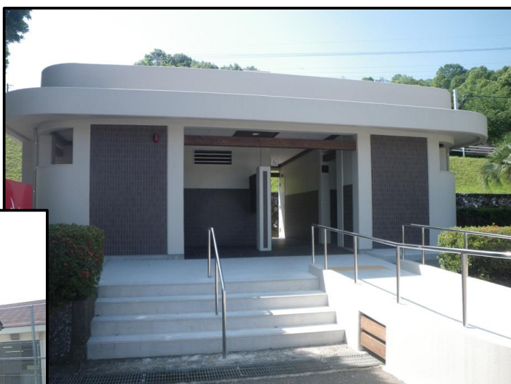
大王谷運動公園トイレ