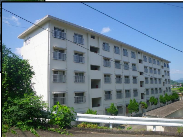
櫛の山住宅ストック総合改善(9号棟)