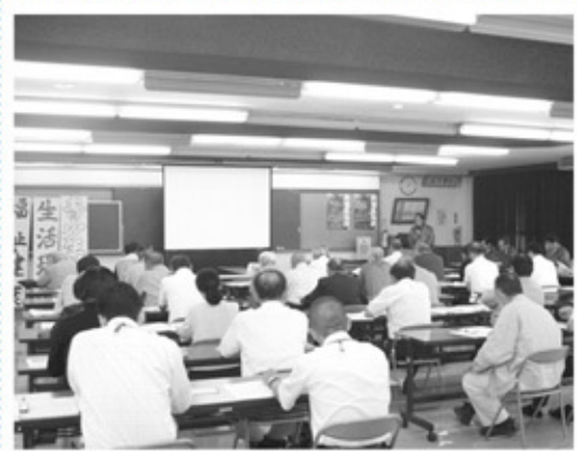
▲視察に来られた都城市の方々