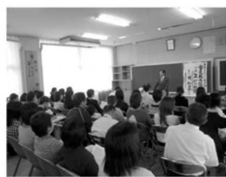
▲林先生の講演に真剣に耳を傾ける地域住民の方々

地域の宝である子どもたちを守り育てていくためには、地域の人たちの力が必要なのだと改めて感じました。