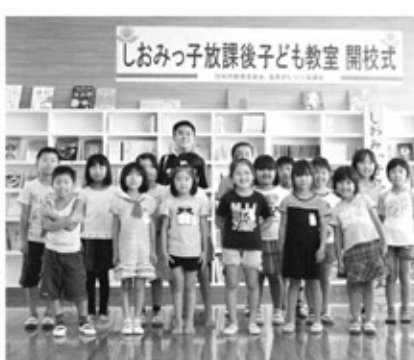
▲開校式(8月29日塩見小学校図書室にて)

現在、協議会では、塩見地区内にある公共施設の指定管理者受託に向けて取り組んでいます。管理者となれば、施設を柔軟に活用しながら更なる協議会活動の活性化と、地域間交流が拡大されるのではないかと思われます。