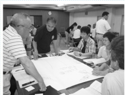
▲ファシリテーターを招いてのワークショップの様子