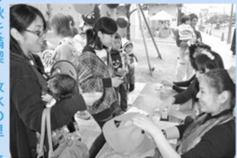
▲お母さんと一緒に今日は楽しい「ハロ ウィンの日」

創設6年目を迎えた「日 向市市民まちづくり支援事 業」。23年度下半期募集に 対し、イベント系及びその他の事業 に3事業の応募があり、全事業が採 択されました。 ◆山田洋次監督50周年&日向市 制施行60周年記念名作上映会 山田洋次監督の監督生活50周年 と日向市制施行60周年を記念し、10 月22日に市内の中学生を対象とし た「学校Ⅳ」の観賞会が開かれ、翌 日の23日に、山田監督の代表作3作 の上映会が行われました。 22日の観賞会では、山田監督と中 学生が直接触れ合う時間もあり、想 い出に残る良い経験になったよう です。