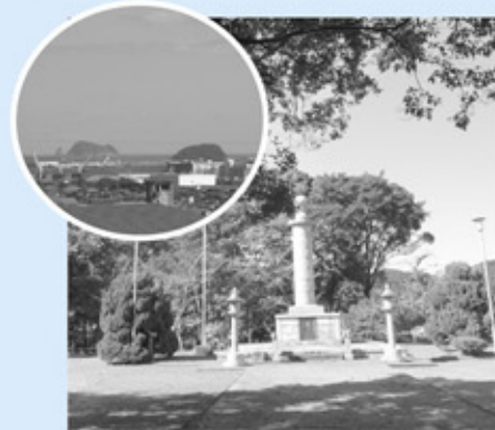
△殉国慰霊塔の丘と、そこから見える景色☆

北町2区は、市の中心地の商店街、北町の西側に位置し、海拔約8m、12mの、県道より1段高くなった所にある閑静な住宅街です。現在、区加入世帯114世帯、人口291人、となっています。 北町は昭和40年に住居表示制度により誕生した町です。それまでの日知屋字亀崎北地域が北町1区、富高字尾の鼻地域が北町2区として自治会を結成しています。 現在、屋外拡声受信設備やカラオケ機器、プロジェクター等の設備を備えた北町2区公民館を拠点に、9人の役員と13人の班長により毎月末に例会を開き、自治会活動を進めています。