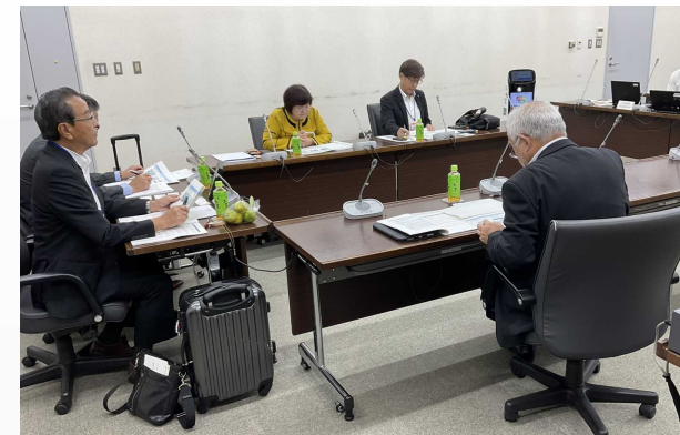
【 相模原市視察時の様子 】

○人口減少などの地域課題を見据え、DXを制度的にしっかり位置付けている点に先進性を感じた。単なるデジタル化にとどまらず、「幸せに暮らせるまち」を軸に人材、産業、住民包摂(インクルーシブ)まで統合しており、他自治体の模範となる取組みである。