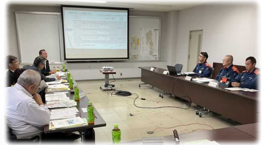
大和市視察時の様子