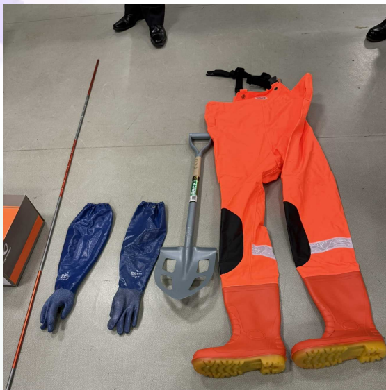
【 穴あきスコップ、胴長靴等の資機材 】

令和6年度の救急出動件数は、2,088件に達し、観光客増加に伴って山岳地帯特有の交通事故や温泉利用中の事故が多く発生している。また、山岳救助の出動や芦ノ湖を有することから水難救助の出動もあり、救助活動は複雑かつ多岐にわたっている。箱根町には大規模病院がないため、近隣自治体の二次・三次救急医療機関との連携強化が不可欠となっている。加えて、搬送時間短縮を図るために、ドクターヘリの活用も年々増えている。職員数は103名でほぼ定数(104名)を満たしているが、育児休暇や定年延長などの働き方改革の影響で人員不足や年次有給休暇の取得の難しさが課題となっている。