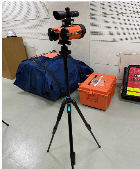
【 崩落監視システム 】