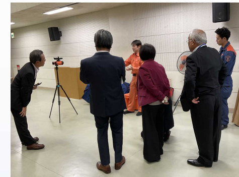
【 箱根町視察時の様子 】