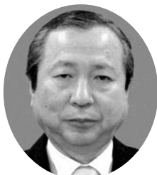
公明党市議団 (比良町・公・7回)