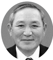
政真会 (庄手・無・4回)