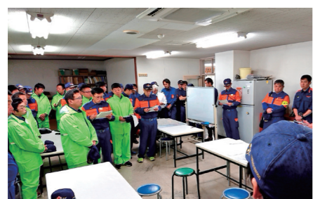
行方不明者が出た場合、多くの消防団員が出勤し、一斉に捜索を行います。