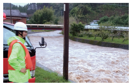
台風や大雨などで河川の氾濫の恐れがある場合などには警戒にあたります。