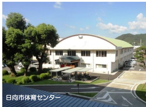
日向市体育センター