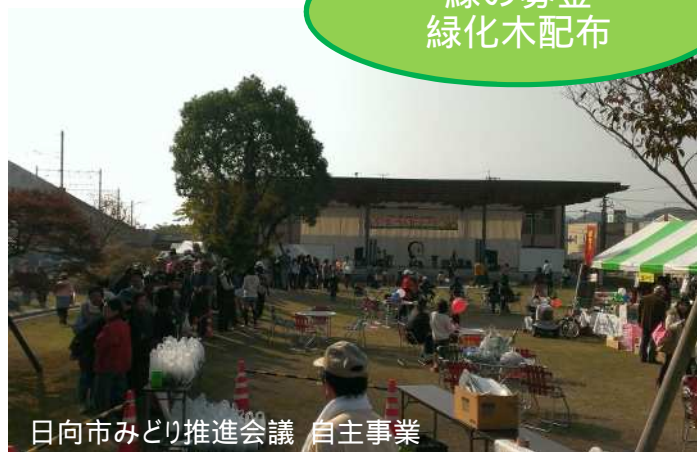
日向市みどり推進会議 自主事業