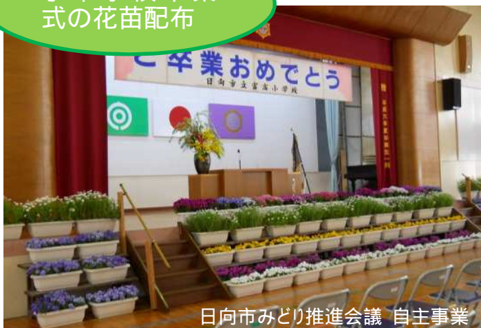
日向市みどり推進会議 自主事業