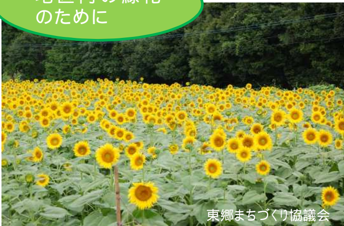
東郷まちづくり協議会