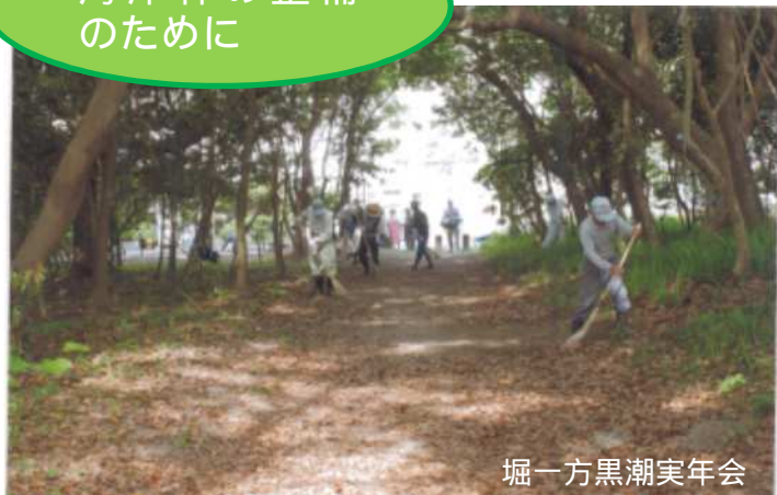
堀一方黒潮実年会