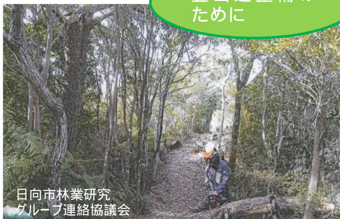
日向市林業研究 グループ連絡協議会