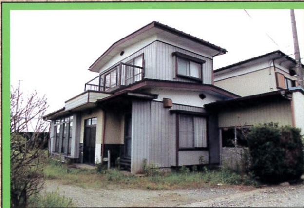
適正に管理されている空家