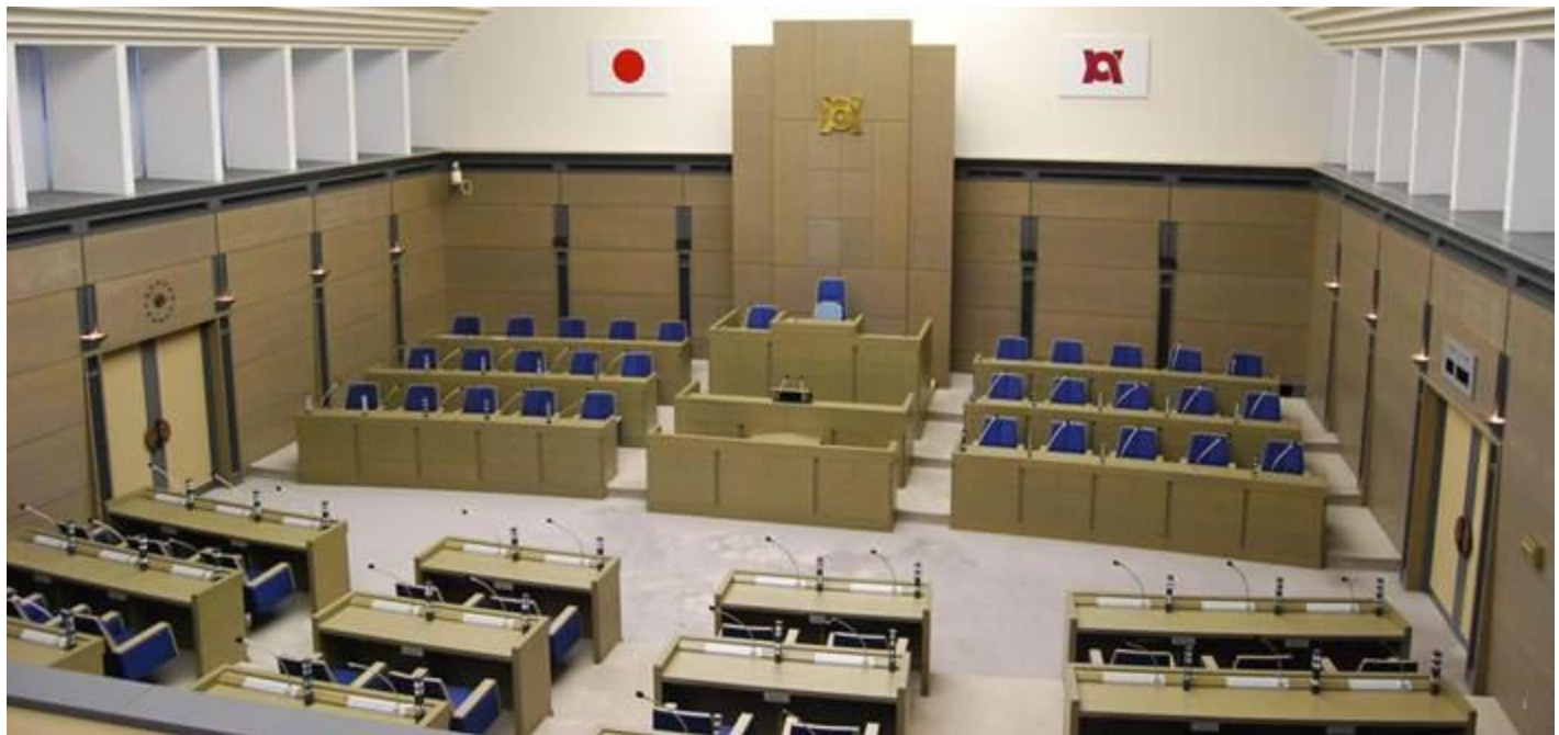
(亀岡市議会議事堂)