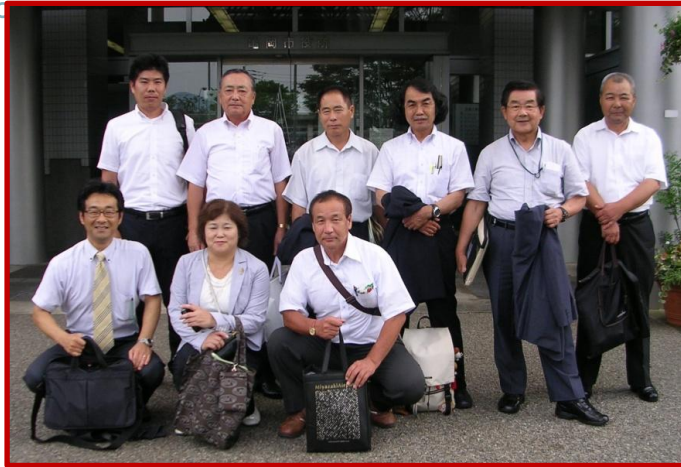
(亀岡市役所玄関前にて)