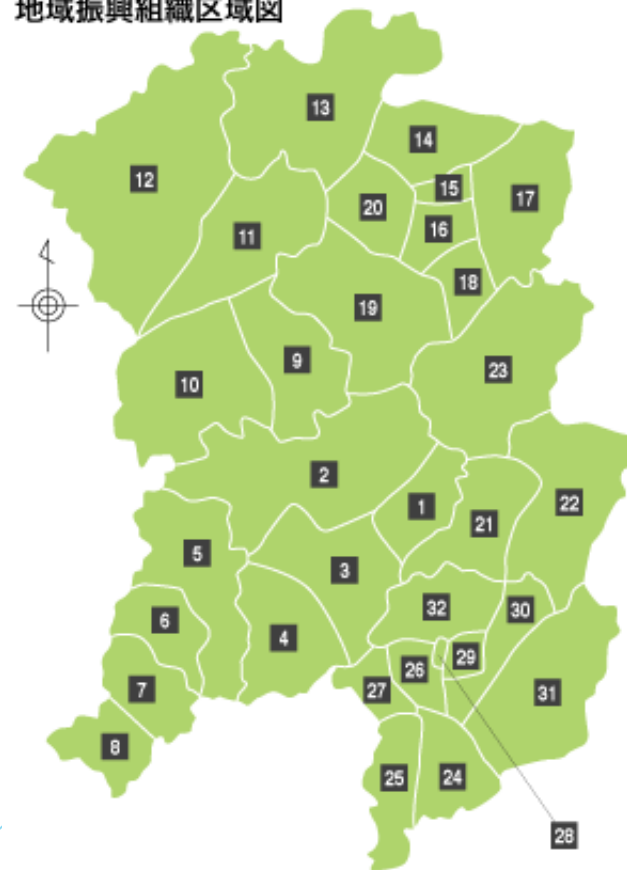
安芸高田市 地域振興組織区域図

* 連合組織 ・・・・・・各地域振興組織の意見を集約し、地域間の連携等を図っている。