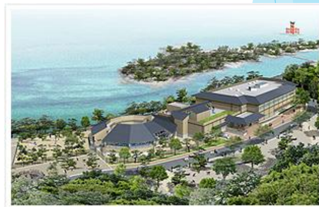
宮島水族館の全貌