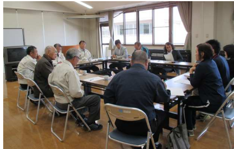
東郷地域包括支援センター

地域包括ケアシステム構築の中心的役割を担う市内6ヶ所(日向中央・日知屋・大王谷・財光寺・南部・東郷)の地域包括支援センターの活動状況等を現地調査し、委員会で議論を重ね、必要な提案・提言を行います。ほかに市民からの提案として位置付けた陳情・請願の審査も行っています。